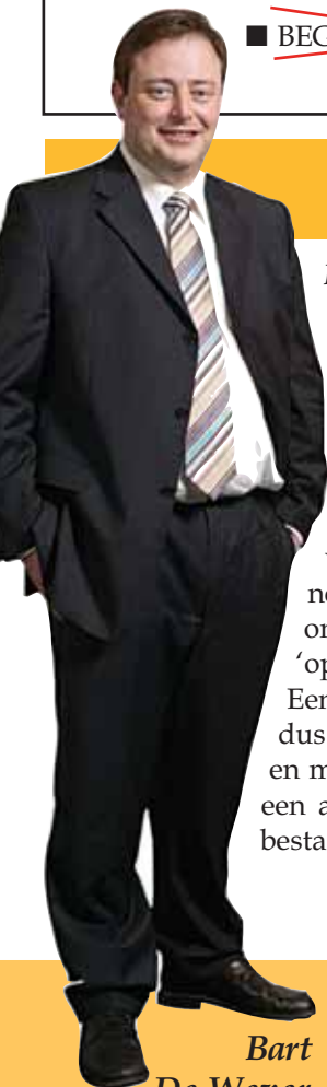
Bart De Wever N-VA-voorzitter