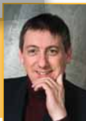
Jan Jambon, Kamerlid